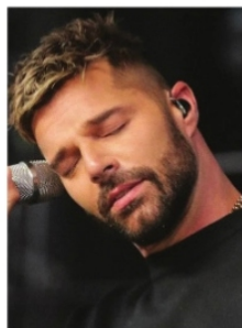
RICKY MARTIN , cantante.

Cuenta la leyenda que habría un inconveniente para el gobierno de David Monreal . La veda electoral por la consulta de revocación de mandato a la que se someterá el presidente Andrés Manuel López Obrador inició el 4 de febrero y