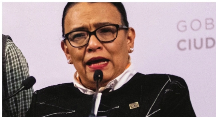
ROSA ICELA RODRÍGUEZ, secretaria de Seguridad y Protección Ciudadana.

En Zacatecas seguimos en el atraso de nombrar dirigiendo el todo al apto para encabezar una de las partes, la