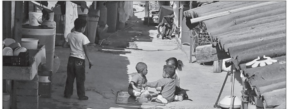
El asunto de las políticas públicas en México no sólo es que sus diseños son modelos reproductores de los problemas sistémicos de la nación, que se encuentran sostenidos por una gran columna a la que coloquialmente denominamos <<pobreza>>

A pesar de que la política que viene instrumentando la Secretaría de Hacienda y Crédito Público en los tres años previos, nos ha llevado a que el PIB del 2021 esté en los niveles del 2016 y la economía este enfrentando rezagos productivos, escasez de productos y presiones sobre precios e importaciones caras, continúan privilegiando las llamadas finanzas “sanas” y la reducción de la deuda, causantes de tales problemas.