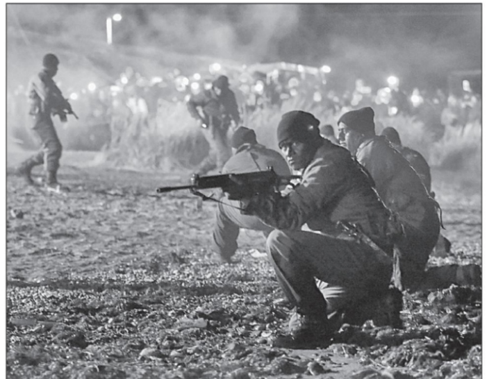
Soldados argentinos de Río Grande, en Tierra del Fuego, realizan un simulacro de desembarco en las islas Malvinas a 40 años del inicio de la guerra

En 1994 este reclamo fue incorporado a la Constitución Nacional ( https://bit.ly/3NjIEp ). ■