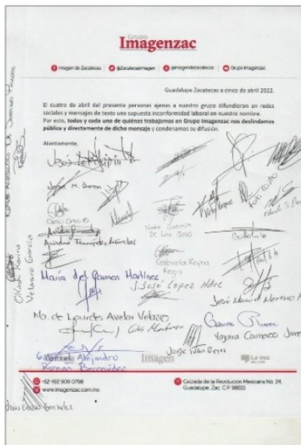
PERSONAL del grupo Imagenzac se deslindeó del boletín.