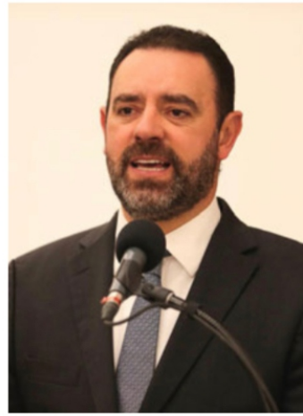
Alejandro Tello Cristerna