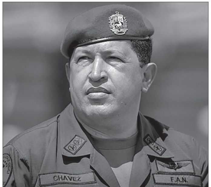
Hugo Chávez