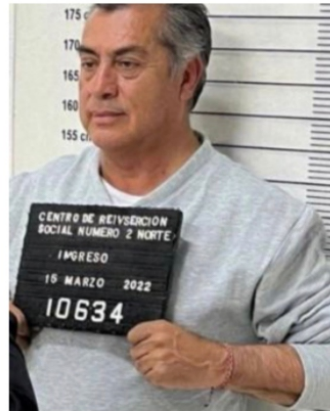
Jaime Rodríguez “El Bronco”