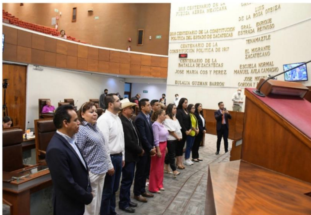
ZACATECAS tiene 30 diputados locales.