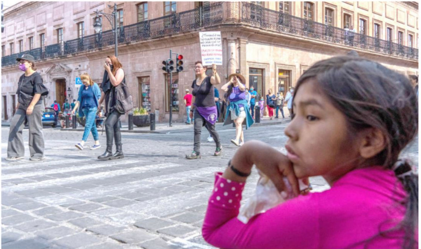
“¡Basta de ceguera, nos están matando!”

Y LA HERMOSA niñita viendo pasar la manifestación, con su carita morena triste, pensativa, acaso preguntándose ella misma