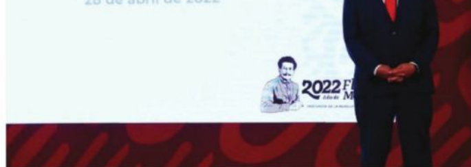
ANDRÉS MANUEL LÓPEZ OBRADOR presentó una propuesta de reforma electoral.

y propiciando la corrupción al grado que el lugar más seguro para robar dinero público es en los partidos, al cabo todo termina en una multa al instituto político no al ladrón de carne y hueso.