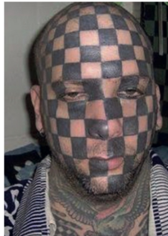
¿Por qué apostarle a los tatuajes?