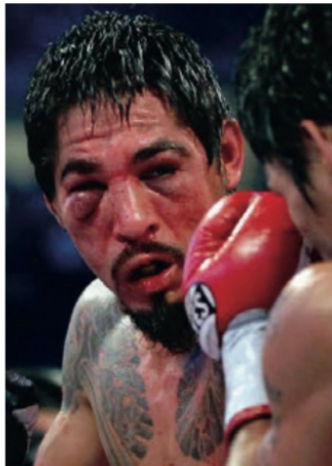
¿Por qué apostarle al boxeo?