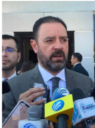
Alejandro Tello Cristerna