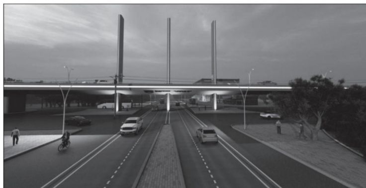
Este miércoles, Gobierno del Estado presentó el proyecto de modernización de la vialidad El Orito-entronque salida a Guadalajara; considera una inversión de 300 mdp

Insisto, el impulso a los emprendedores y a las micro y pequeñas empresas, así como la ubicación geográfica de la entidad y el plan del gobierno para mejorar la red de carretera de Zacatecas, podrían ser la mezcla perfecta para que el regreso a la nueva normalidad represente también mejoras en la calidad de vida de los zacatecanos y sus familias. ■