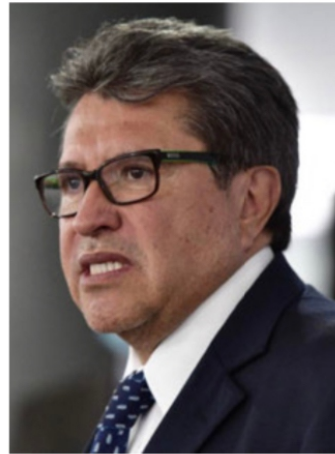
Ricardo Monreal Ávila