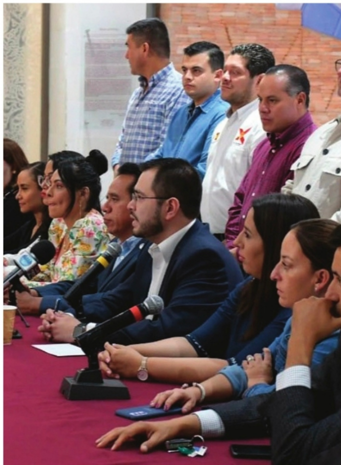
DIPUTADOS DE OPOSICIÓN en el Congreso local.

Criticaron el presupuesto aprobado por ellos mismos, denuncian a los que interpusieron recurso ante la justicia electoral desconociendo