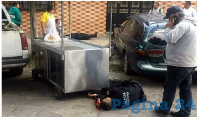
Ya son 26 los policías asesinados en este año (Foto ilustrativa)