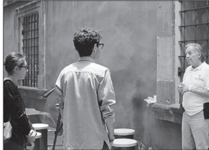
Detrás de cámaras del documental titulado ¿Quién? ¿Quiénes? Nadie. Voces del 68, dirigido por Lydia Leija, Fernando Montes de Oca y Rodrigo Ortega