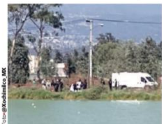
LEVANTAMIENTO del cuerpo en Cuernavaca, ayer.

Es el cuarto en 6 meses; atletas dan cuenta del hecho; situación rebasa a la autoridad, reconoce titular del In-deporte; persiste abandono e inseguridad. pág. 17