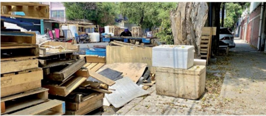
Vecinos de la Calzada Coltongo afirman que fueron amenazados por los dueños de las tarimas.