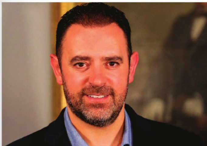
ALEJANDRO TELLO CRISTERMA, exgobernador del estado de Zacatecas.

La Mesa de construcción de paz debiera comunicar con perspectiva histórica, más allá de las cifras, las acciones de la delincuencia en territorio zacatecano para que la población acopie la experiencia de los últimos quince años, cuando la delincuencia organizada dominó la escena tan confiada en su poderío, que celebraba carreras de caballos (Ciudad Cuauhtémoc) Organizaba festejos decembrinos multitudinarios con Heriberto Lazcano (Calera), montaban casas con grupos de secuestrados (Colonia Arboledas) y de los antros del centro histórico se llevaban jóvenes desde entonces no hallados.