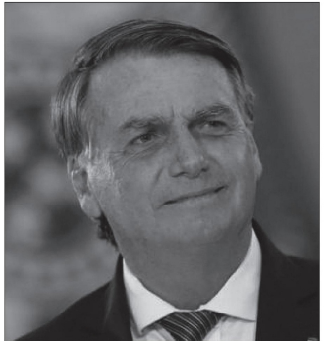
El presidente de Brasil, Jair Bolsonaro

Será un sexenio perdido, con fuertes retrocesos en el sector productivo que conducen a la economía a un largo período de estancamiento con presiones inflacionarias y crecientes requerimientos de entrada de capitales, que nos colocan en un contexto de alta vulnerabilidad. Pemex ha tenido que colocar deuda en los mercados financieros internacionales al 9.25%, en momentos en los cuales la economía no genera condiciones de pago, a pesar del alza del precio internacional del petróleo, debido a la fuerte contracción económica que arrastramos y al déficit de comercio exterior creciente.■