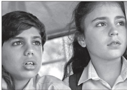
Fotograma de la cinta 1982: el año que cambió el Líbano (2019)

dos a lo lejos y el espectáculo inquietante de fumarolas y explosiones cada vez más cercanas, incrementan la tensión en el interior de un salón de clases donde el apremio de la disciplina, contrapunto para calmar la angustia, se vuelve algo muy azaroso. Lo interesante en la observación (o evocación autobiográfica) del cineasta es la diferencia radical en la manera en que los adultos y los niños asistirán a ese drama bélico.