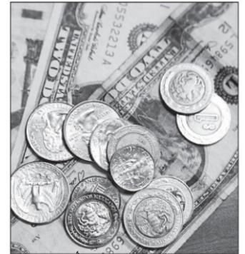
Parece que entre nosotros la crisis ha perdido todo significado y, lo más grave, todo impulso para apurar algún cambio

Hablar de una crisis de representación es tentador, pero no es fácil hacerlo si sólo se consideran los resultados de la elección del 5 de junio. Sin que nadie pueda hablar de que se acudió a las urnas en medio de una feroz polémica sobre la inflación y la cercanía del temido estancamiento, lo cierto es que Morena y su gobierno obtuvieron los votos mínimos necesarios para seguir confiados en su camino. Y no se diga el Presidente. Sin embargo, se mueve con particular