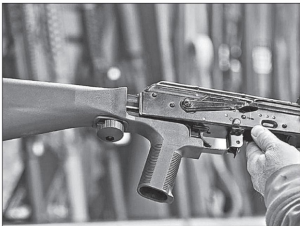
En EU hay más de 400 millones de armas en circulación, es decir, más armas que personas