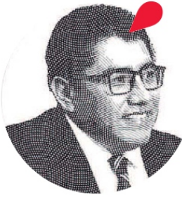
Saúl Monreal Ávila