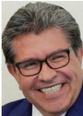
RICARDO MONREAL , senador.

Hasta el dirigente de MC, Dante Delgado , reconoce que Ricardo es una de las figuras más importantes de la 4T y ningunarlo les puede traer un costo. Finalmente, Monreal en el Senado fue pieza clave para impulsar reformas de AMLO como la revocación de mandato con consulta popular y el proyecto de la Guardia Nacional.