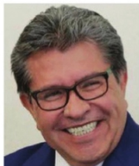
RICARDO MONREAL , senador.

Mientras en Coahuila recibían al senador Ricardo Monreal con las porras: "¡presidente! ¡presidente!", en Zacatecas ya se andan acomodando la estructuras para apoyar