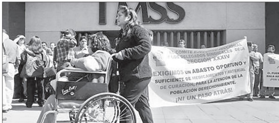
Desde hace décadas, el colapso institucional en México es una problemática inminente que se ha sorteado en la miseria presupuestal y en los más escándalos casos de corrupción

L os bancos centrales están aumentando la tasa de interés para frenar la actividad económica, incrementar el desempleo, reducir la demanda y así las presiones inflacionarias, y dicen que ello no ocasionará un contexto como en los años setenta, donde se contrajo la economía y hubo presiones inflacionarias.