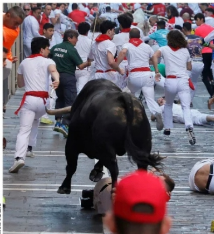
GRAN AFLUENCIA en el regreso de la tradición.

Cabe mencionar que Ernest Hemingway vio por primera vez los Sanfermines en Pamplona a los 24 años de edad, estancia que inspiraría varias de sus novelas siendo esta la primera de muchas visitas posteriores. En 1959 hizo su última visita y como gran admirador de las ferias taurinas no se perdía corrida alguna. En 1926 publicó la novela que lo consagró en un escritor exitoso, Fiesta (the sun also raises) que sin duda ayudó a que se conocieran los Sanfermines en todo el mundo. Sin duda esta experiencia debe de catalogarla como imperdible por lo que le pido a la vida me permita vivirla una vez antes de partir. El encanto de la fiesta de San Fermín tiene hechizado al mundo ya que según los de Pamplona con San Fermín se olvidan todas las penas. Hasta la próxima.