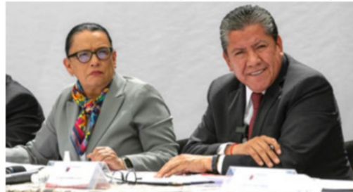
"Las cosas no han sido fáciles, pero el trabajo comprometido del Gobernador y de los presidentes nos ha permitido avanzar", refirió Rodríguez.

Gracias al Trabajo Coordinado Entre los Gobiernos de México y Zacatecas, se han Reducido los Índices Delictivos en el Estado: Secretaria de Seguridad Rosa Icela Rodríguez