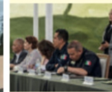
La Secretaría de Seguridad Pública Municipal trabaja de la mano de la población para lograr acciones contundentes.

Fortalece Capital de Zacatecas Plan de Seguridad a Lado de Autoridades Estatales