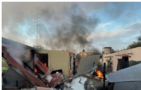
Jerez, Zacatecas.- Esta es una de las casas que los narcos incendiaron ayer a plena luz del día y sin que nadie lo impidiera: Jerez, vive entre el terror y la impunidad; muchos jerecanos ya hacen maletas para cambiar de aires, tienen temor de morir en alguna de tantas balaceras

* Los Asesinatos, no Ceden: Cuatro Ejecutados