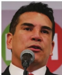
ALITO MORENO, Líder Nacional del PRI.

Unos lo odian y otros todavía lo defienden. Así se trasladó la discusión en Zacatecas por la permanencia de Alejandro Alito Moreno , en la dirigencia nacional del