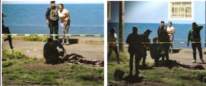
Un joven fue asesinado y dos más heridos de gravedad en un ataque armado cuando las tres personas se encontraban reparando un vehículo en la esquina de las calles Arturo Espino y Antonio Dovalí Jaime, colonia H. Ayuntamiento en la capital zacatecana. Al rededor de las 22:15 horas seccion alertaron de fuertes balazos muy cerca de las vías del tren, por lo que policías y paramédicos se trasladaron al lugar. Al arribar, un joven de 19 años se encontraba sobre la calle ya sin signos vitales y dos hombres más de aproximadamente 30 y 45 años se encontraban heridos de bala. Los hombres fueron trasladados al hospital más cercano, mientras Policías municipales y Estatales, acordaron la zona para que policías de investigación se encargaran de las investigaciones.

* Asesinan a Mujer en Fresnillo; en Zacatecas Matan a Joven