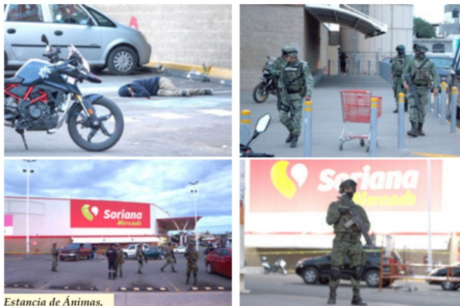
Guadalupe, Zac.- Ataque armado en el estacionamiento de Mercado Soriana dejó como saldo un civil fallecido, presunto sicario y tres policías municipales heridos de gravedad. Gran movilización policíaca generó el ataque, lo que también provocó persecuciones policíacas que tuvo como resultado dos personas detenidas, además de un vehículo incautado. Policías de investigación resguardaron la escena del ataque y elementos del Ejército Mexicano resguardaron la zona.

Estancia de Animas, de Luto por 3 Ataúdes