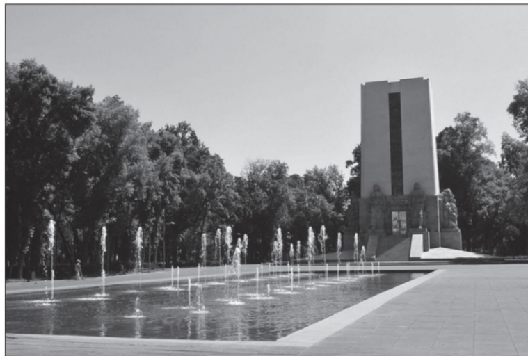
Parque de la Bombilla, en la Ciudad de México

Al ver mi pelo blanco, una hierbera me tiende un manojito de distintas hojas y dice con voz de mando: Hágase su té. Tengo para la diabetes, la presión, los riñones, el insomnio. También gotitas para los nervios, todo es natural. Mire mis cremas: son superhumectantes y muy buenas para sus manos; tienen cuatro aceites que le ayudan con la piel seca. También tengo el champú contra la caída del cabello y esta pomada buenísima para los dolores de espalda, cuello, rodillitas... Huélala, clienta, sin compromiso. También hago acupuntura, aquí mismo le puedo poner las agujas o voy a su domicilio, si no le gustan las agujas, tengo este cinturón antiestrés... Con 20 minutos que se lo ponga queda usted como nueva. Aquí la esperamos, madre. ■