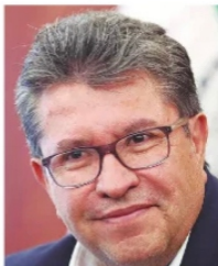
RICARDO MONREAL, senador. ...

Una parte de quienes entraron al equipo del gobernador David Monreal lo hicieron mediante el senador Ricardo Monreal . Y ahora a estos, recriminan los allegados al senador, ya se les olvidó.