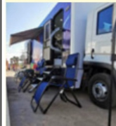
Más de 20 personas de El Maguay donaron sangre voluntariamente

Lleva Ayuntamiento de Zacatecas Unidad Móvil Para Donación de Sangre a Comunidad El Maguay