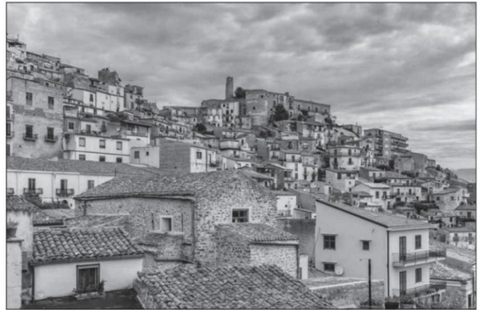
Pueblo de Cammarata en Sicilia, Italia

El movimiento de los pintores zacatecanos tiene mucho por dar, ya hemos mencio-