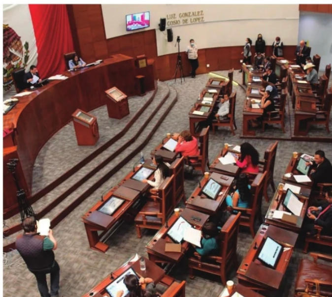
DIPUTADOS integrantes de la 64. Legislatura.

La intelectualidad seducida por el salinismo, la academia rehén del apoltronamiento inducido, los medios de comunicación que creyeron eterno el soborno institucionalizado, juntos