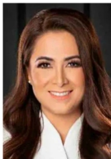
TERE JIMÉNEZ, gobernadora de Aguascalientes.

Por si fuera poco, ayer el mismo tribunal electoral prohibió a los morenistas realizar eventos de promoción de precandidatos, ya sea para la presidencia de la república o para la regiduría más recóndita. Estos después de los eventos de la corcholatas a la presidencia a los que asistieron Adán Augusto, Monreal y Claudia Sheinbaum . Esta resolución complicaría las campañas que ya se tenían planeadas para