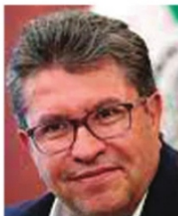
RICARDO MONREAL, Senador.

De manera intempestiva, pero con mucho "punch" se anunció la presencia del senador Ricardo Monreal en la 35 convencional regional noreste del Instituto Mexicano de Contadores Públicos, la participación del ex gobernador llenó de júbilo a los promotores zacatecanos.