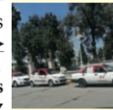
Sitio Jardín de la Madre

Fresnillo: Taxistas dan su Propio “Toque de Queda”: por los Altos Índices de Inseguridad, no Trabajan de Noche