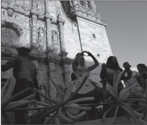
La marcha de la diversidad en Zacatecas es todavía un híbrido entre una fiesta de aceptación y amor y una apropiación del espacio para señalar las deudas públicas que las instituciones, las familias y los individuos tienen hacia la comunidad