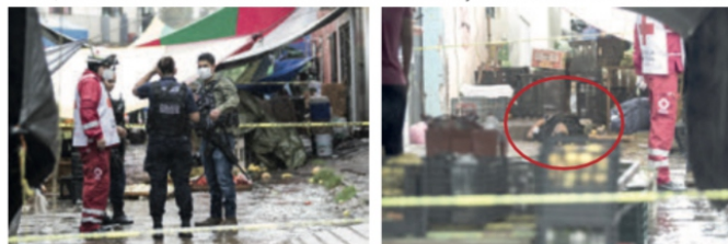
Zacatecas, Zac.- Un hombre de aproximadamente 35-40 años fue asesinado a balazos cuando se encontraba vendiendo frutas y verduras en un tianguis de la capital zacatecana. El ataque armado se presentó alrededor de las 15:00 hrs, cuando en el tianguis instalado sobre la calle Ferrerocarril, de la colonia Purpilla-Natera, un joven arrojó un arma sobre uno de los comerciantes que trabajaba en su puesto; después del cobardes asesinato el sicario huyó corriendo por las calles adyacentes sin que nadie se atreviera a impedirlo.

* En Jerez Asesinan a dos Motociclistas, en Ojocaliente Masacran a Otro