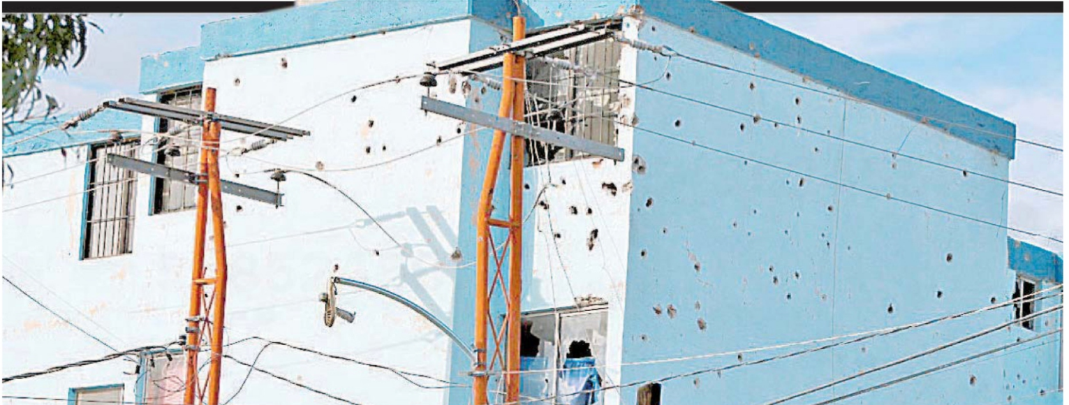
A raíz de estos acontecimientos, las clases se suspendieron y varios comercios prefirieron no abrir