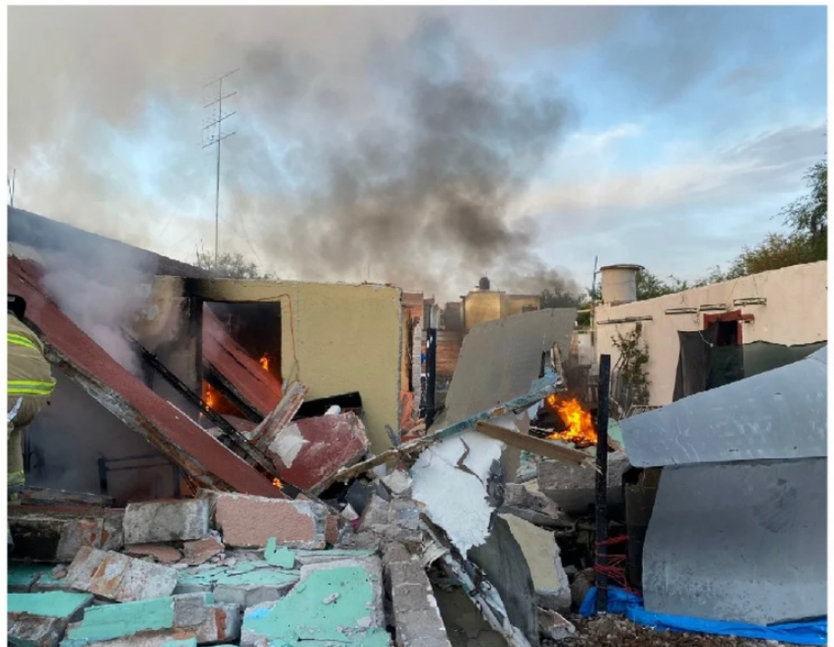
EL ENFRENTAMIENTO DEJÓ GRAVES daños en casas del municipio.

LUTO Mundial Líderes mundiales condenan el asesinato del ex primer ministro de Japón, Shinzo Abe. MUNDO PÁG. 11