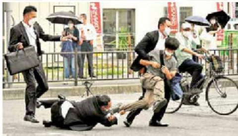
Fotos revelaron que el agresor, quien fue detenido tras el ataque, estaba cerca de Abe cuando éste daba un discurso en la calle.

veces contra Abe. Admitió su responsabilidad y dijo que guardaba rencor contra una "organización específica" y que creía que Abe formaba parte de ella. El arma utilizada "es claramente