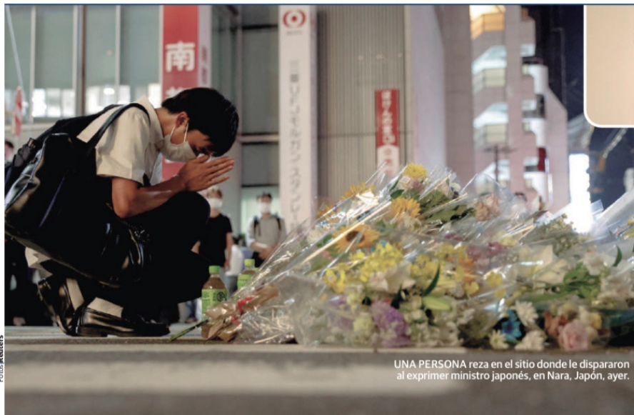
UNA PERSONA reza en el sitio donde le dispararon al exprimer ministro japonés, en Nara, Japón, ayer.

Ahora, autoridades buscan fosas en Black Jaguar-White Tiger pág. 6