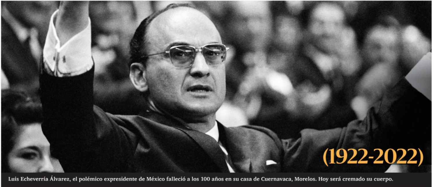
Luis Echeverría Álvarez, el polémico expresidente de México falleció a los 100 años en su casa de Cuernavaca, Morelos. Hoy será cremado su cuerpo.