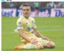
MIQUEL SERRA, EFE