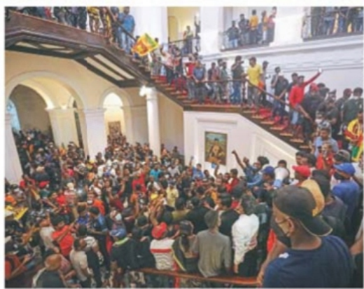
CHAMELA KARUNARATHNE, EFE