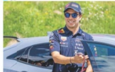
CHRISTIAN BRUNA, EFE