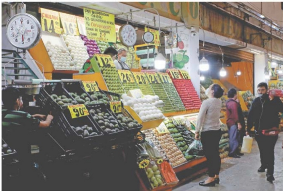
La naranja y el aguacate son los alimentos que han subido más de precio en la administración actual.

Carestía fue de 15% en el gobierno anterior, reporta el Inegi; alertan de enfermedades y población que no podrá comer tres veces al día