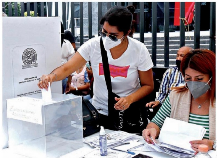
Los telefonistas sindicalizados votaron a favor de realizar un diálogo con la empresa.

En lo que va del año, la Administración ha dado de baja a casi un centenar de policías por irregularidades.