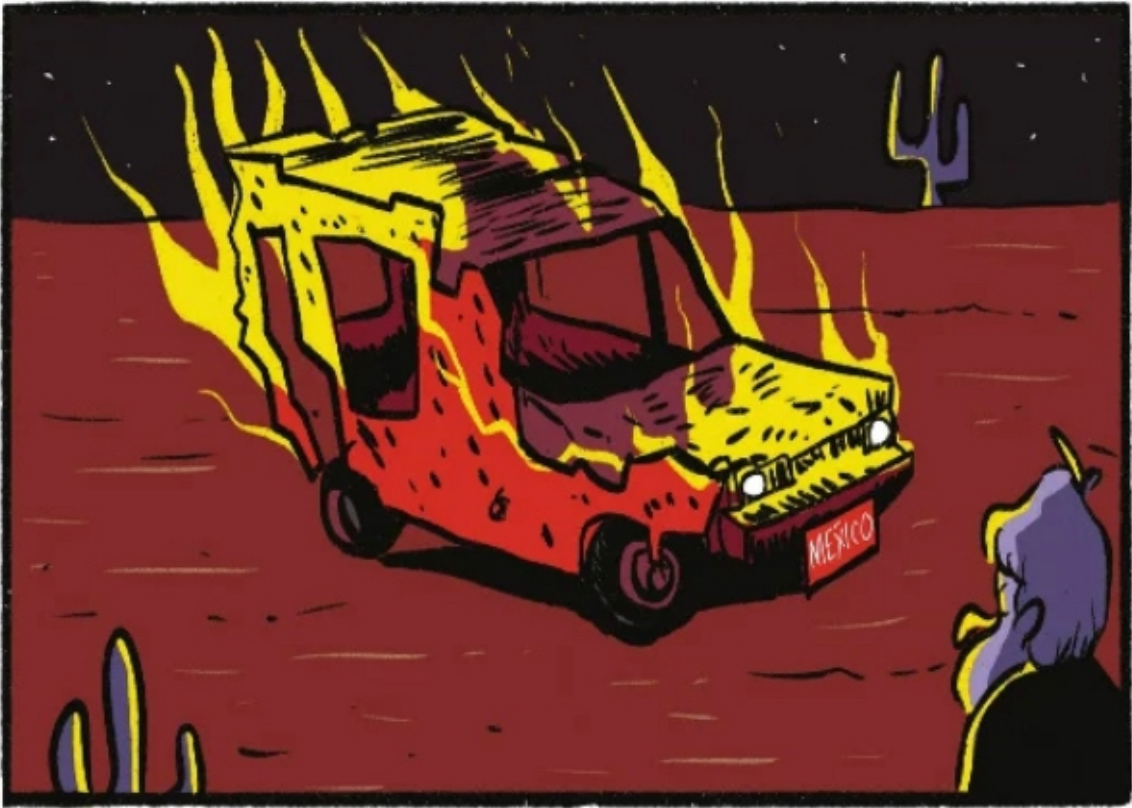
w u i s h o e n I m a g e n