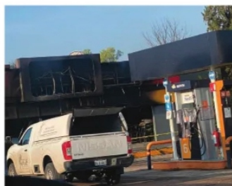
TIENDA OXXO incendiada en Ojocaliente.

en Zacatecas ya se prenden los focos amarillos por incidentes similares a los ocurridos en el vecino estado, la gente se preocupa por qué advierte que escenarios similares se vivieron previo a la turba de violencia que padecen hoy en Guanajuato y Jalisco. Jerez, Fresnillo, Ojocaliente, y otros municipios ya han sufrido esos incidencias consecuencia de la presencia de grupos del crimen organizado.