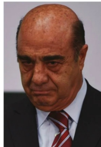
JESÚS MURILLO KARAM, exprocurador general de la República.

los gobernadores y alcaldes piden resultados, en lo de los métodos suelen desentenderse mientras no trascienda.