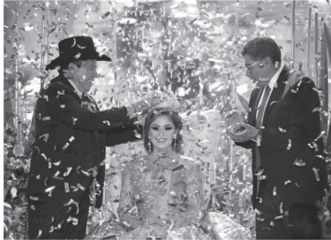
La simbólica coronación de la simbólica reina (cosa que pone a llorar a los constitucionalistas y al numeral décimo segundo de la carta magna) es el también simbólico acto de inicio de la Feria Nacional de Fresnillo

Secretarios, diputados, alcaldes, asesores y aquellos que se han alcanzado a colar en el primer eslabón de ciudadanos, desde la primera fila, compartieron sus fotos en todas las redes. De la cerca hacia arriba, donde comienzan los lugares del pueblo -que dicho sea de paso le da sentido al nombre de este teatro- unos 15 mil fresnillenses y foráneos disfrutaron, de forma gratuita, uno de los espectáculos más cotizados del regional mexicano; el mismo espectáculo que con la característica voz del chiapaneco y la pluralidad de decenas de músicos que suelen acompañar a Álvarez, lo colocan como uno de los más carteleros del país.