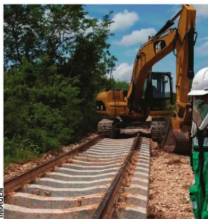
EL TREN MAYA y su polémica construcción que es criticada por ambientalistas.

Comenzaré con las mentadas "corcholatas". El hablar de Claudia Sheinbaum y su comportamiento turístico nos da ciertas esperanzas ya que rescató la Fórmula 1, evento por demás importante para la capital nacional. También ha encabezado campañas para impulsar los conciertos, cultura, museos, etc. para el apuntalamiento de la actividad después de la pandemia. Independiente a los cambios que se han dado en su secretaría de turismo