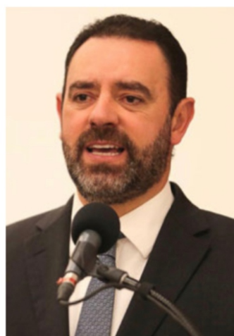
Alejandro Tello Cristerna

muchos de quienes se la jugaron con él en las pasadas elecciones, ni siquiera les ha dado las gracias, pues anda muy ensoberbecido, tanto, que se cree la última Coca-Cola en el desierto".