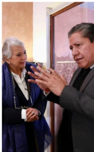
OLGA SÁNCHEZ CORDERO Senadora.

A pesar de que prácticamente toda la clase política y académica se alineó y buscaba al menos saludar a la senadora y ex Secretaria de go-