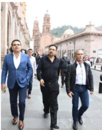
MIGUEL TORRES, Diputado federal.

de Villanueva, quién busca y quiere mantener un espacio como diputado federal, y en el mejor de los casos convertirse en Senador de la República, convocó a Silvano Aureoles Conejo , ex gobernador de Michoacán y a Miguel Angel Mancera , exjefes de gobierno de la ciudad de México y Senador por el PRD, Como siempre en las giras políticas se les dió un recorrido express por la ciudad y museos de Zacatecas, luego en corto, en restaurante fífi, les dieron las quejas y posibilidades del partido amarillo en la entidad.