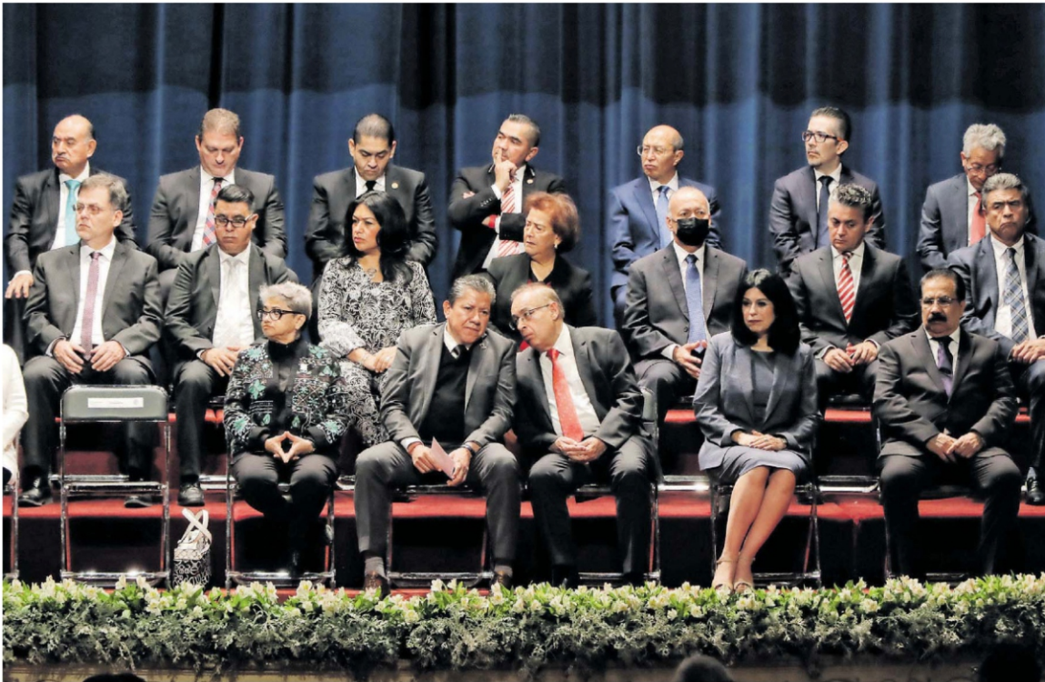
Zacatecas, sede de la 3ra. Sesión Plenaria de la Comisión Nacional de Tribunales Superiores de Justicia de Estados Unidos Mexicanos.

SE INAUGURÓ LA 3RA. ASAMBLEA DE LA CONATrib