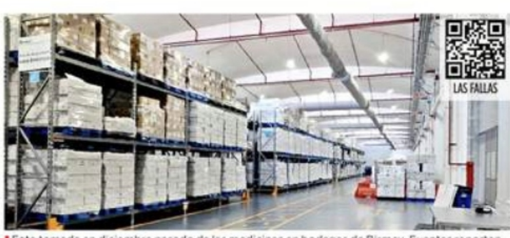
Foto tomada en diciembre pasado de las medicinas en bodegas de Birmex. Fuentes reportan que los fármacos siguen ahí.

Entre dos MUNDOS Gabriela Ortiz navega en la música de concierto, de la cual es una de las compositoras mexicanas más relevantes, y en la música popular, con la cual creció. CULTURA (PÁGINA 21)