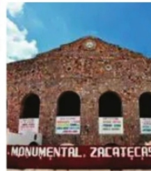
PLAZA DE TOROS ZACATECAS, Fenaza 2022.

Luego de los profusos anuncios de que cancelaba el serial taurino de la Feria Nacional de Zacatecas, allegados a la empresa y taurinos de hueso colorado, salieron a informar por cuenta propia y en redes sociales personales, que, las corridas de toros se llevarán a cabo, que la empresa cuenta ya con equipo expertos legales, encabezados por uno de los despachos más importantes del país, para celebrar la fiesta y cumplir el contrato que fue celebrado con el gobierno del Estado.