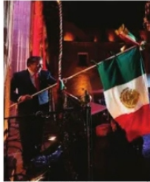
DAVID MONREAL Grito de Independencia

Aún no arrancan los tiempos de los informes de gobierno de las fiestas patrias o entregas de apoyos y demás, y muchos presidentes y, principalmente funcionarios de primer nivel de gobierno del estado, ya están pensando y agendando cuando se van de vacaciones a disfrutar sus beneficios económicos y laborales. La mayoría habrá de exigir su espacio en los respectivos gritos de independencia, con todo y "la cruz", su lugar en el desfile del 16 de septiembre, pero, a partir del diecisiete: "como dijo Nicanor".