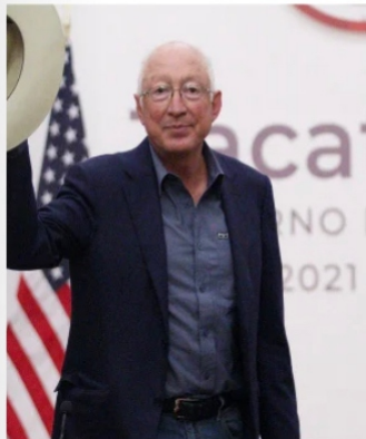
KEN SALAZAR, Embajador de EU en México.

Empresarios de Zacatecas están pensando en invitar una vez por mes, al súper embajador a que nos visite; incluso, hasta ponerle casa en Bernardez.