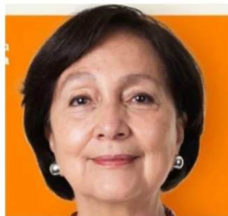
AMALIA GARCÍA, Diputada Federal.

El fin de semana fue notoria la presencia de carros de perifoneo con la imagen de la ex gobernadora de Zacatecas, Amalia García Medina , al mismo tiempo, en redes sociales se desplegaba una amplia campaña publicitaria; el pretexto es el informe que habrá de rendir la señora, pero, muchos ya la ven perfilándose para ocupar un escaño en el Senado, o al menos reelegirse como diputada federal. Tiene todo el apoyo de Dante Delgado, mandamás y dueño de Movimiento Ciudadano, habremos de esperar cuando los demás aspirantes naranjas empie-