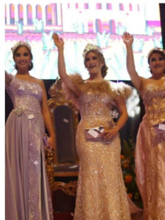
CORONACIÓN, en la Fenzaza 2022.

Mucho más organizada y tranquila fue la coronación de la reina de la casa del jubilado de Issstezac, armonía y buenas maneras predominaron en la coronación de