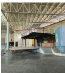
TERRAZAS Multiforo Fenaza 2022

Cuándo se empezó a organizar la feria nacional de Zacatecas, hubo mucha especulación de quiénes serían los nuevos agraciados para operar antros, cantinas, terrazas y barras en la feria. En el arranque, ya se pudo vislumbrar quiénes son los favorecidos del nuevo Patronato.