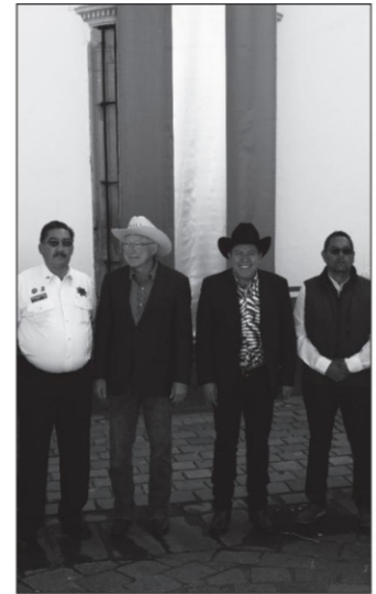
El embajador de Estados Unidos en México, Ken Salazar, con el gobernador del estado, David Monreal

noble y leal ciudad con su respectiva comida facturada con cargo al bolsillo del Gobierno del Estado, se desquite no sólo en las fotos que circula en sus redes, el cuadro chico del gobernador; ojalá se les quite de los hombros paisanos, el enorme peso que tienen en la economía zacatecana. Ojalá los migrantes que con sus divisas alimentan las bocas del millón y medio que siguen en el Estado, sean un tema prioritario: los que están allá, los que nunca pudieron regresar y los que todavía no saben que se van a tener que ir. ■