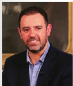
ALEJANDRO TELLO, EX GOBERNADOR DE ZAC.

En todas la gubernaturas que ha ganado morena desde la unción de