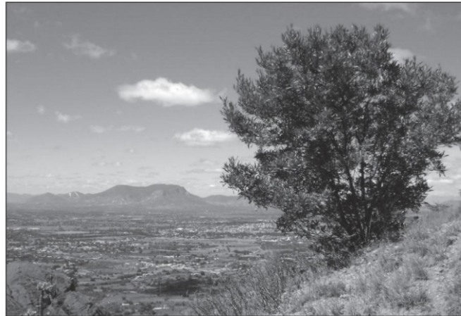
El Valle del Mezquital es árido, semidesértico, nos dice el poeta Antonio Zambrano