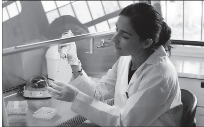
El Sistema Estatal de Investigadoras e Investigadores tiene el objetivo de reconocer las labores de investigación y desarrollo tecnológico realizadas en la entidad por los mismos

fomentar la ciencia, la tecnología y la innovación en general, como instrumento para desarrollar, de manera armónica y sustentable, las capacidades científicas y tecnológicas de Zacatecas en estos rubros.