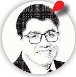
Saúl Monreal Ávila