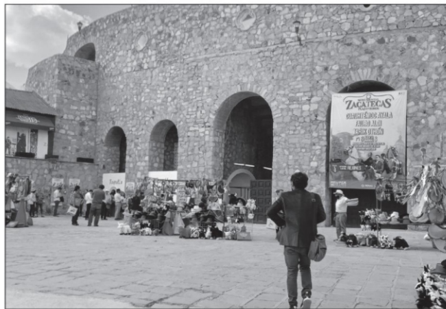
En la edición 2022 de la Feria Nacional de Zacatecas la afición apenas si acudió a la Plaza de Toros en los 10 festejos

la dinastía Moreira, en Coahuila, desembocaron en la prohibición de la fiesta de toros en ese estado, y por José Aguirre, dinámico empresario de telecomunicaciones en la región, obtuvieron la concesión del serial taurino de la Feria Nacional de Zacatecas 2022.