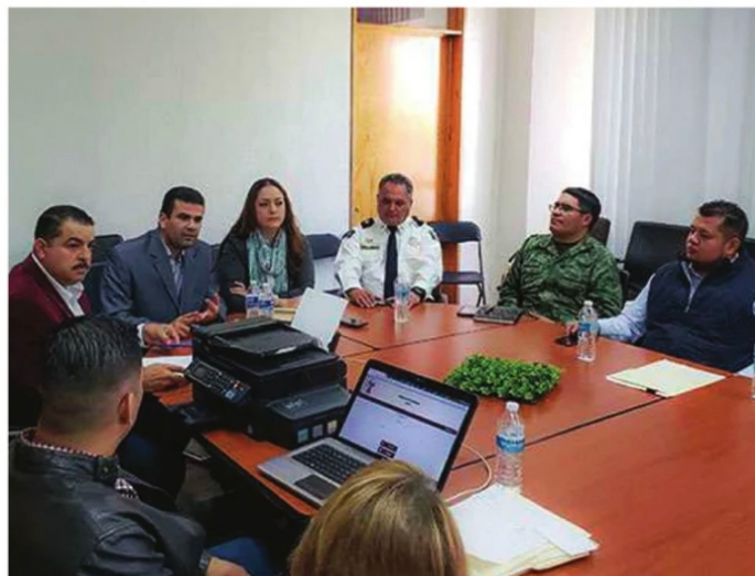
ES NECESARIA UNA ACCIÓN COORDINADA para enfrentar a los retos de la delincuencia.

Cuando el "efecto cucaracha" que provocó Felipe Calderón llegó a nuestro estado la autoridad se atuvo al centro, se endeudó al estado para construir nuevas instalaciones militares en Jalpa y en Fresnillo, vimos a la policía federal hospedarse en céntricos hoteles y a