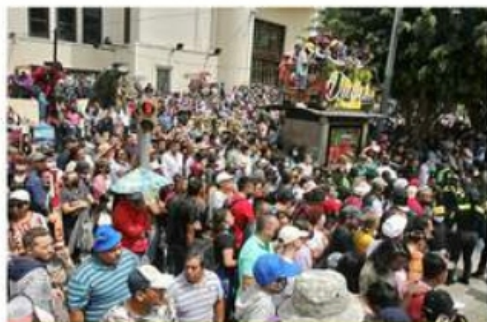
Los ciudadanos se desbordaron ayer para presenciar el desfile por la Independencia de México.

Algunas de las víctimas ya presentaron las denuncias correspondientes ante la Fiscalía del estado, mientras el Consejo recomendó a los instaladores de paneles solares abstenerse de aceptar proyectos que impliquen la visita a un lugar alejado y sin que se realice un anticipo económico.