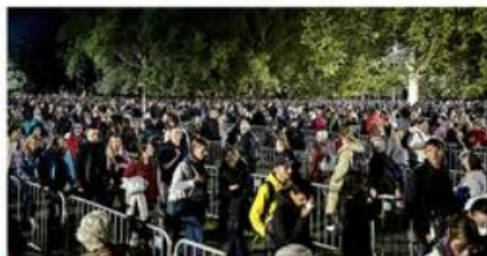
Miles de personas hacen fila para entrar al Parlamento.