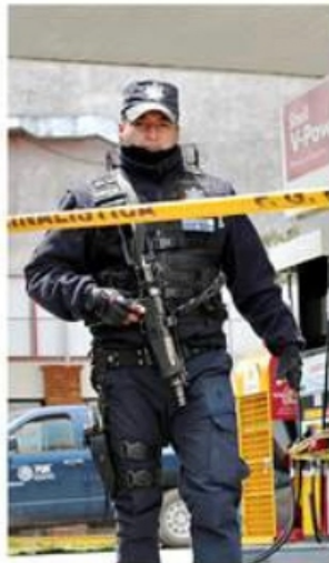
Agentes de la Fiscalía colocaron sellos de aseguramiento en los inmuebles.

Apenas el 6 de septiembre, trabajadores de CFE fueron víctimas de la violencia en Sonora, donde dos de ellos murieron en un ataque al estilo del crimen organizado.