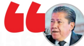
DAVID MONREAL ÁVILA GOBERNADOR

Reconoció que hay rubros con "muy poco" recurso como son las carreteras a las que se destinarán sólo 86 millones de pesos, monto que calificó también como "muy modesto", pues las necesidades son más grandes que eso; superan a las que se pueden cubrir con esta cantidad, que aunque no es mala, tampoco es suficiente. Debido a lo anterior -dijo- buscará otros métodos para beneficiar al sector carretero. Pág. 5