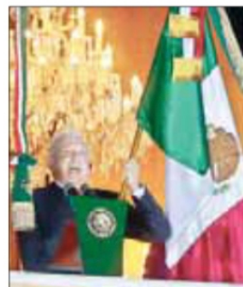
▲ El mandatario, en Palacio.

ALONSO URRUTIA, GUSTAVO CASTILLO Y EMIR OLIVARES / P 4 Y 5