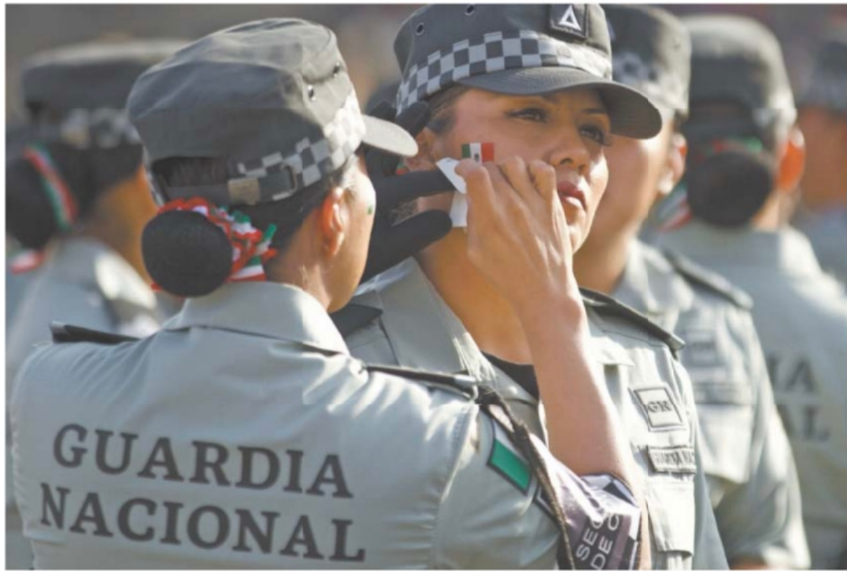
Mujeres integrantes de la Guardia Nacional hicieron distintivos patrios, como banderas en las mejillas y listones tricolores en el cabello.

El secretario de la Defensa afirma que actúan apegados al marco jurídico, sin pretensiones de ningún tipo; no buscamos reflectores ni aplausos, dice el titular de Marina