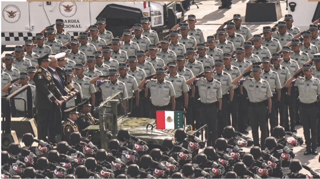
EL PRESIDENTE junto con titulares de la Sedena y la Semar pasan revista a elementos de la Guardia Nacional, ayer.

NUEVA CORPORACIÓN YA ESTÁ ADSCRITA A LA DEFENSA