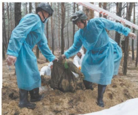
Entre los cuerpos exhumados cerca de Izium se encontraron los de familias enteras, incluyendo niños, dijo el gobierno ucraniano.

45 mil HABITANTES tenía Izium, donde se hallaron los cuerpos, antes de la guerra.