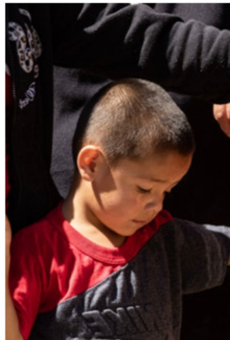
Niños huérfanos llorando la muerte de su padre policía