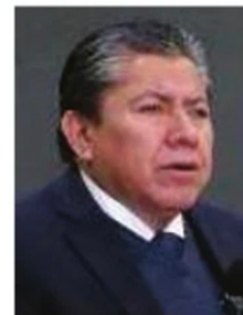
DAVID MONREAL, Gobernador de Zacatecas.