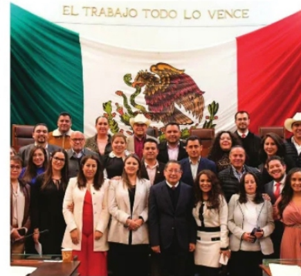
INICIAN COMPARENCIAS, GLOSA PRIMER INFORME DE GOBIERNO.

que se ha preguntado más de treinta veces, el por qué no se les pagó a los maestros al arranque del actual gobierno, y el Secretario de Finanzas respondió lo que ha respondido treinta veces, que: al principio de la actual administración no se contaba con los recursos suficientes.