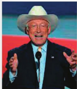
KEN SALAZAR, Embajador de USA en México

El embajador habrá de llegar a Zacatecas el 6 de octubre, por lo tanto habremos de tener al menos cuatro días de tranquilidad y paz social, verá usted como esos días previos los homicidios disminuyen considerablemente..