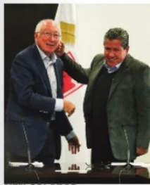
KEN SALAZAR , Embajador de Estados Unidos.

Como lo comentamos, en un hecho sin precedentes, el embajador de Estados Unidos en México, Ken Salazar , visita Zacatecas por segunda ocasión en menos de un mes, fue recibido por el gobernador que le brindó todas las atenciones y cortesías; sin embargo, lo que ya no ocurrirá será la presencia del embajador en la inauguración del congreso nacional Charro.