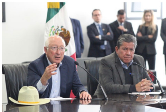
Ken Salazar y David Monreal Ávila

retenes de narcos que cuidan el paso vía terrestre. Entonces por eso los gringos están interesados en impedirlo, porque por Aguascalientes no hay problema, ahí sí hay mucha vigilancia de las fuerzas del orden y difícilmente pasa la droga por su territorio que, además, es muy compacto.