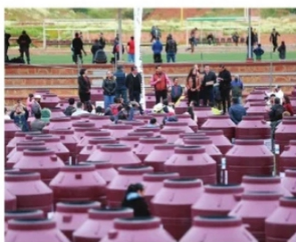
ENTREGAN 1000 TINACOS, en cancha de Guadalupe.

La “innovación” de este ambicioso proyecto que se viene realizando repetidamente desde hace al menos 20 años, es que ahora: los tinacos son color “morado Morena”, atrás quedaron los tinacos blancos o los negros, no los vayan a confundir con alguna otra expresión política. Eso campeones.