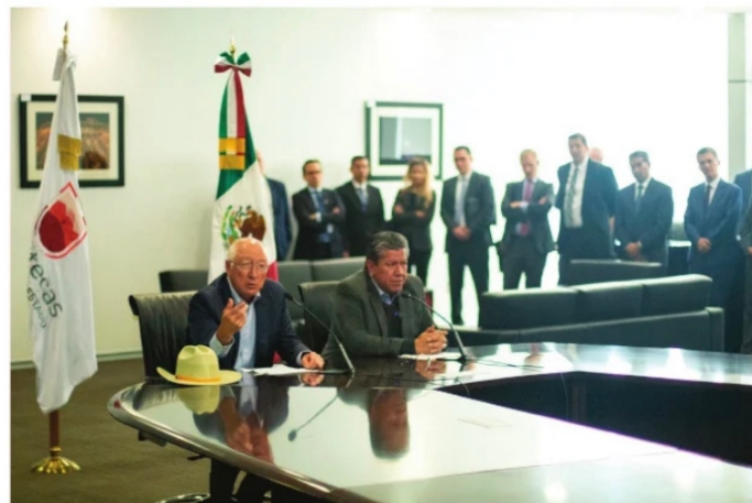
KEN SALAZAR en compañía de David Monreal Ávila

El continuismo que padecemos los zacatecanos tiene una explicación: Los políticos participan en distintos partidos no porque tengan distintos pen-